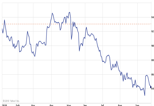
美元兌日圓今年以來走勢

日本十分重視日圓匯價，因與其經濟復甦有密切關係，那央行的干預行動，能否阻止日圓升值呢？相信有關行動只能短暫地遏止日圓上升，而卻無法阻止其長期升勢，主要原因有二。